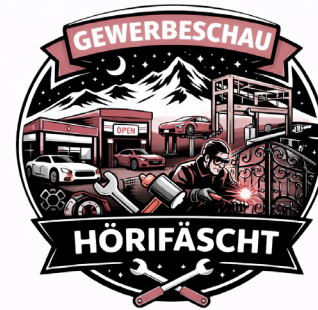
Rund ums Gewerbe